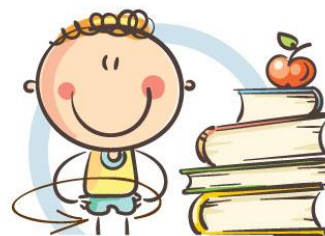
3. ФИЗКУЛЬТМИНУТКА ДЛЯ СНЯТИЯ УТОМЛЕНИЯ КОРПУСА ТЕЛА