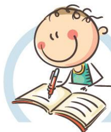
4. СИДИТЕ ПРАВИЛЬНО