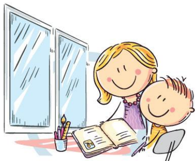
1. ЕСТЕСТВЕННОЕ ОСВЕЩЕНИЕ

ЕДИНЬИЙ КОНСУЛЬТАЦИОННЫЙ ЦЕНТР РОСПОТРЕБНАДЗОРА 8-800-555-49-43