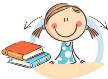
1. ФИЗКУЛЬТМИНУТКА ДЛЯ УЛУЧШЕНИЯ МОЗГОВОГО КРОВООБРАЩЕНИЯ