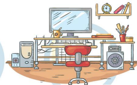
5. СООТВЕТСТВИЕ МЕБЕЛИ