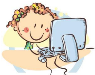
2. ПОЛОЖЕНИЕ МОНИТОРА