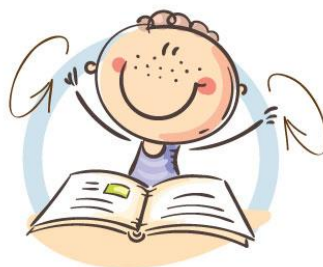
2. ФИЗКУЛЬТМИНУТКА ДЛЯ СНЯТИЯ УТОМЛЕНИЯ С ПЛЕЧЕВОГО ПОЯСА И РУК