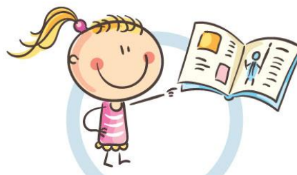
3. РАССТОЯНИЕ ДО КНИГ